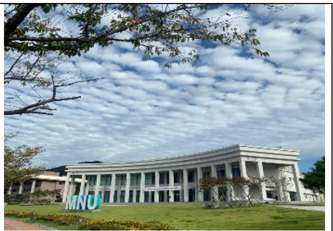
③ 아름답고 쾌적한 캠퍼스 환경