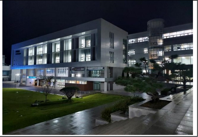
④ 연수생이 언제나 이용 가능한 최첨단 도서관 시설