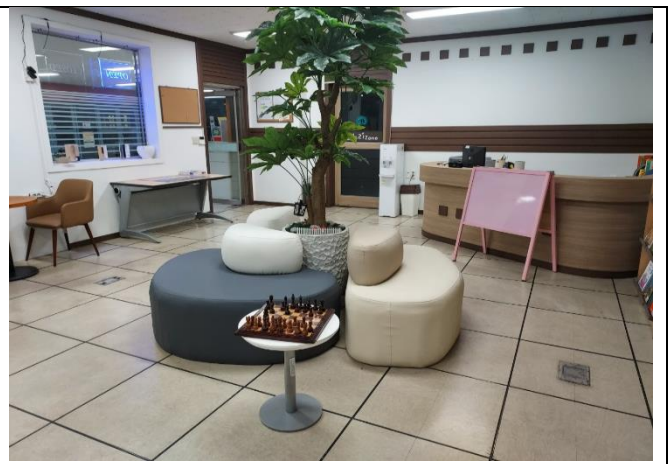
⑤ 온누리 Zone을 통한 한국어, 영어 학습 가능