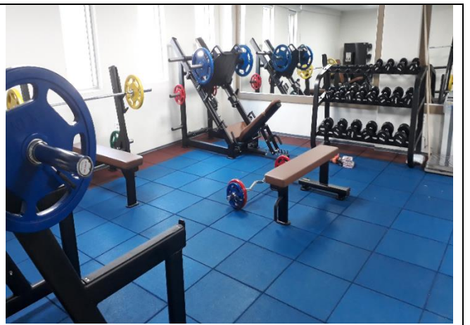
⑥ 깨끗하고 쾌적한 학생생활관 시설 이용 가능