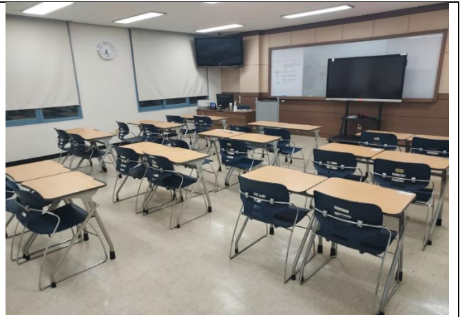
① 최첨단 기자재를 보유한 넓은 강의실